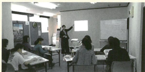
好評だった10月のセミナー